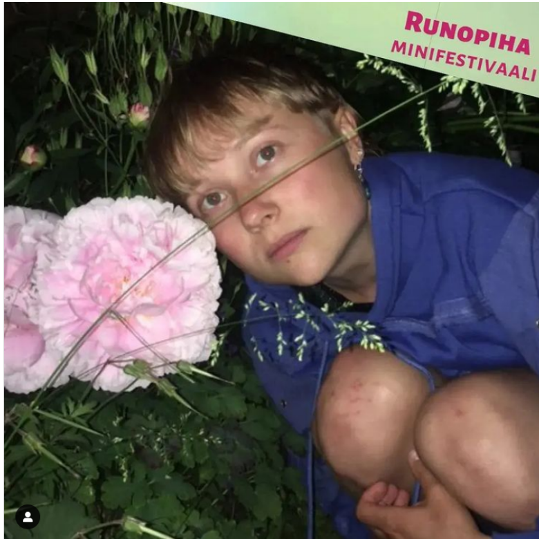
Viitapiiri Ry:n Runopihafestivaaleilla, 6.7.2022

On meneillään hengenvaarallinen ja elämää tappava rakenteellinen kriisi, mutta Helsinki se jatkaa kuin surua ei olisikaan. On etukenossa lähdettävä kokoukseen - yhteinen on jo käynnissä, se voimistuu.