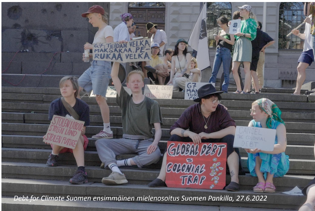
Debt for Climate Suomen ensimmäinen mielenosoitus Suomen Pankilla, 27.6.2022

Samaan aikaan kesällä muutama tuttu herätteli Elokapinassa keskustelua globaalin etelän 27 aloittamaan Debt for Climate -liikkeeseen liittymisestä. DFC ajaa globaalia ilmasto-oikeudenmukaisuutta ja targetoi kolonialistista raha- ja velkapolitiikkaa - Maailmanpankkia ja IMF:ää. Liike kutsuu kaikkia, joiden mielestä rikkaan pohjoisen tulee aloittaa ekologisen velan takaisinmaksu välittömästi ja mitätöidä etelän rahallinen velka, liittymään mukaan ja organisoitumaan omassa yhteisössä.