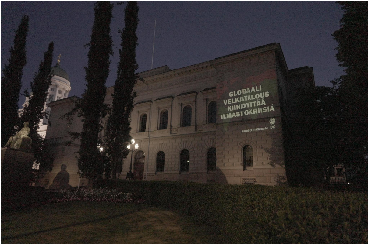
Mielenosoitusta enteilevä tempaus Suomen pankilla, 26.6.2022.

kaltaisteni tehtävä, joiden elämä ei mene perustarpeista selviytymiseen ja jotka hyötyvät valkoisista etuoikeuksista. On aika laittaa käytössä olevia resursseja (aikaa, rahaa, kädet, kehot) työhön. Se kuulostaa suurelta ja abstraktilta, mutta pilkkoontuu ja konkretisoituu, kun liittyy mukaan liikkeeseen, lukupiiriin, kokouksiin - menee mukaan suoraan toimintaan.