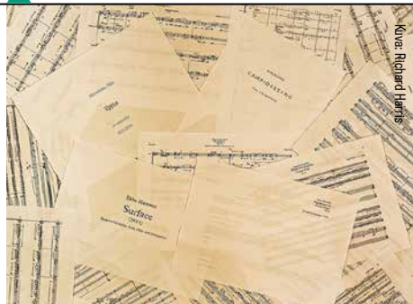
Kuva: Richard Harris